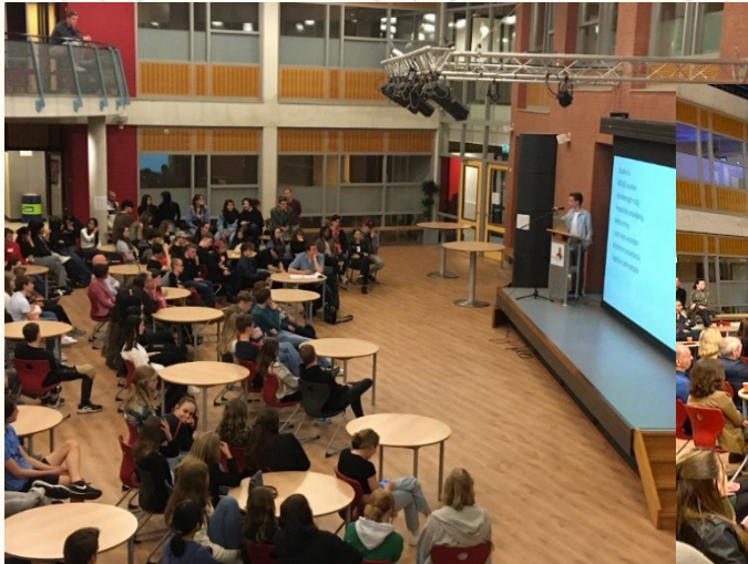
'Pascal Tiemissen tijdens de havo-presentatie