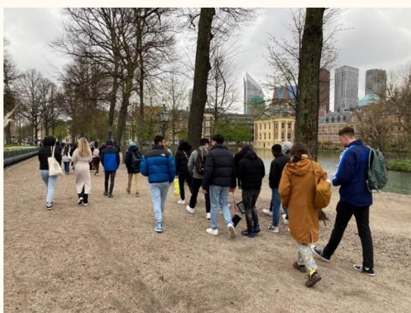
Op weg van Prodemos, huis van de democratie, naar de Tweede Kamer