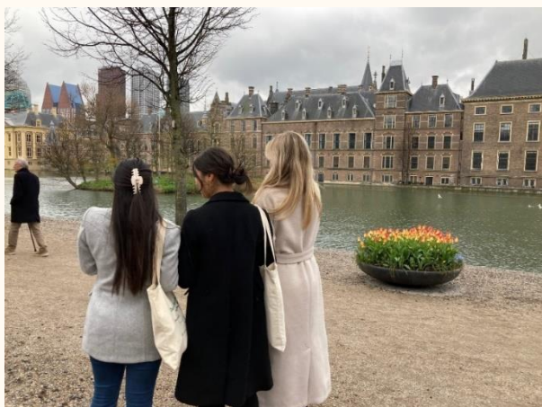
Enkele leerlingen bij Hofvijver met uitzicht op Torentje, Mauritshuis en spraak-makende Haagse architectuur