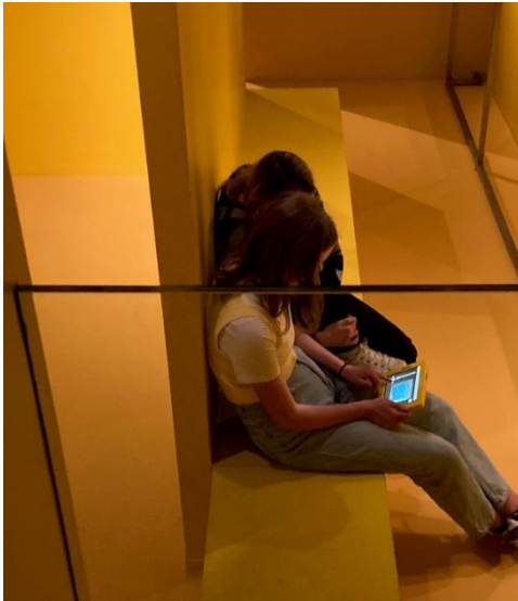
Leerlingen met iPad in tentoonstelling Wonderkamers in Kunstmuseum Den Haag